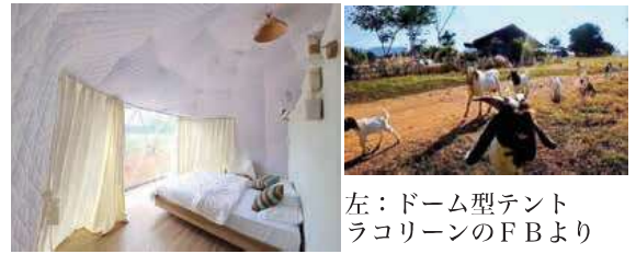
左：ドーム型テント