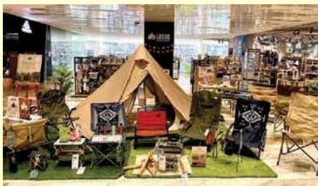
Siam Discovery 1st Fl.