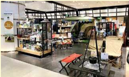
Siam Takashimaya 3rd Fl.