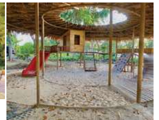
キャンプ場のカフェと遊び場