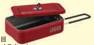
日本でも注目されているメスキット