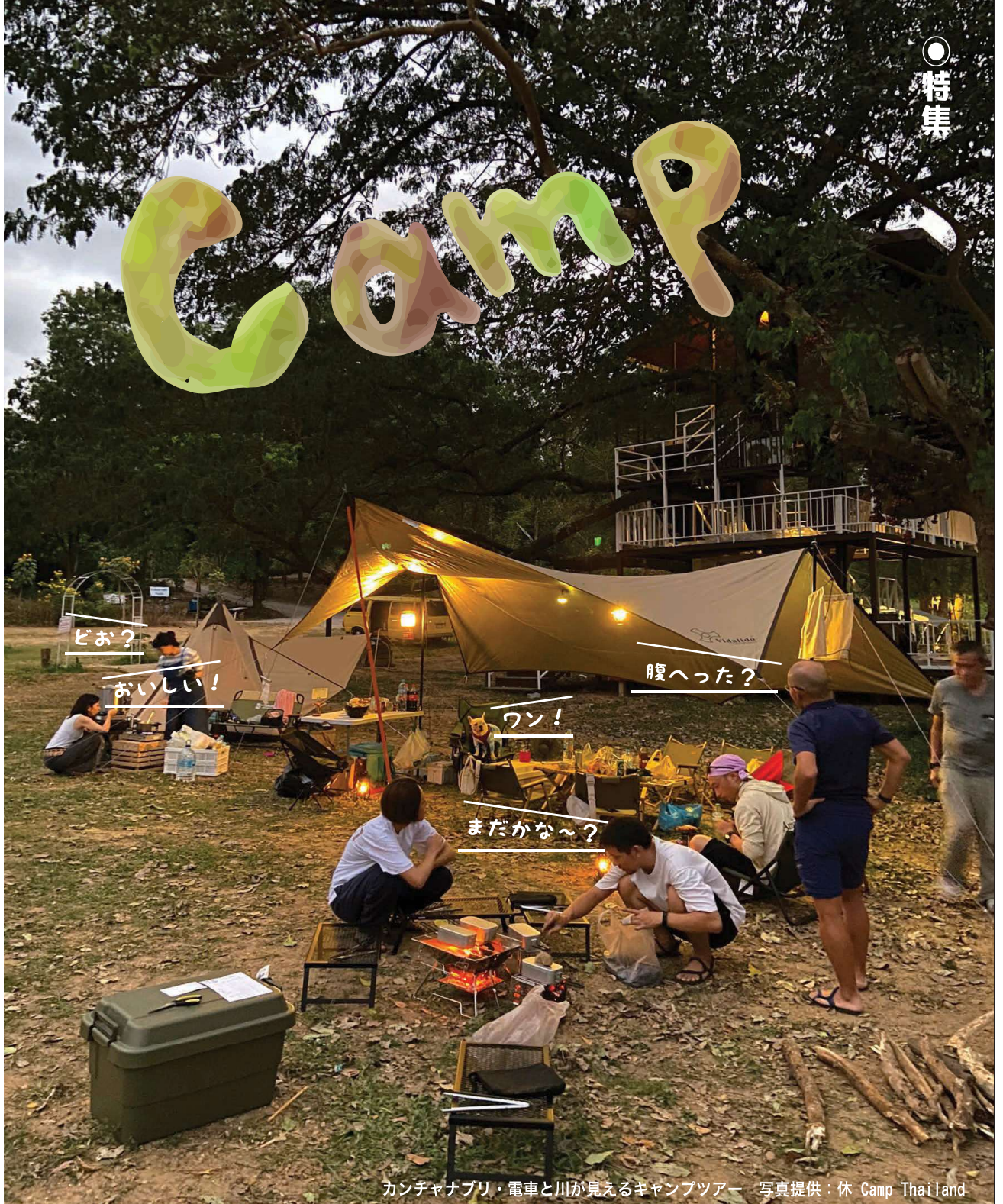
カンチャナブリ・電車と川が見えるキャンプツアー