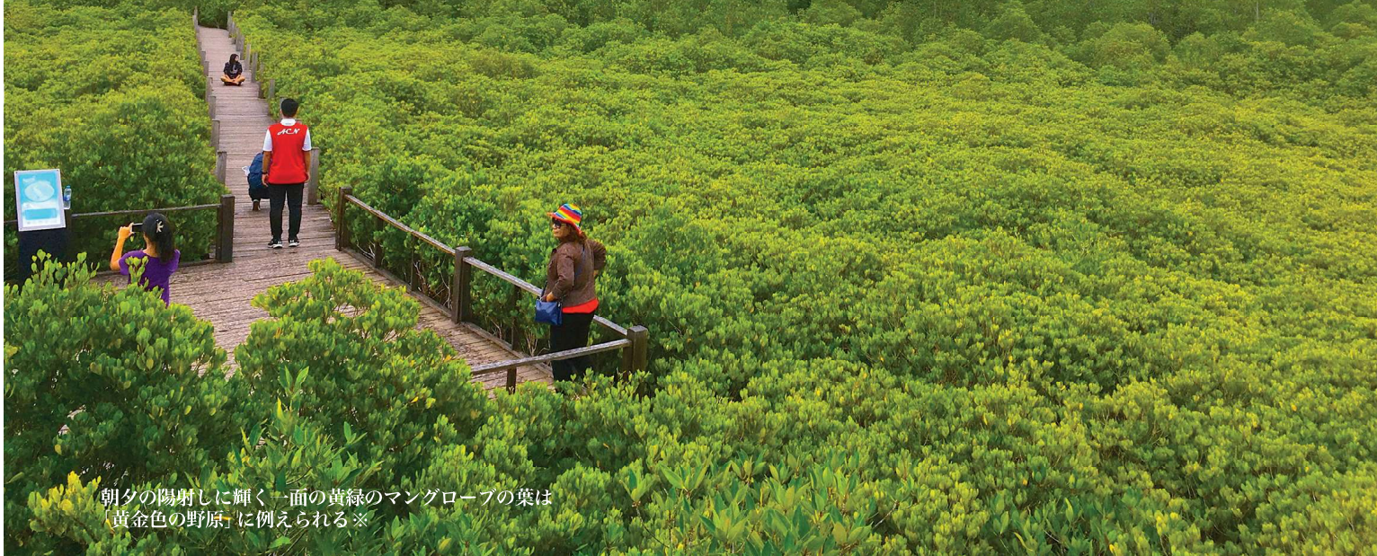
朝夕の陽射しに輝く一面の黄緑のマングローブの葉は「黄金色の野原」に例えられる※