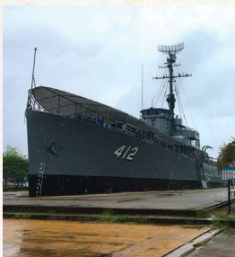
汽水域のマングローブ林の中、遊歩道を歩いていくと、かつて使われていた戦艦が。艦内も見学が可能※