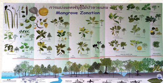
マングローブの植物相を紹介するパネルには英語表記もあり葉や実の特徴も分かりやすい※

ラヨンはバンコクから直通のバスを使って所要時間は3時間程度。パタヤ経由もありますが、時間が倍近くかかることがあるので先に注意。