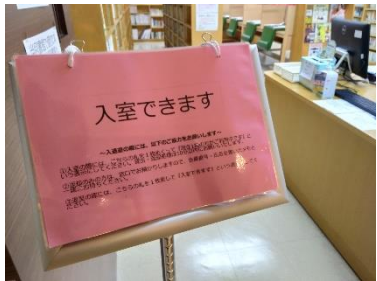
図書館内に誰もいない状態