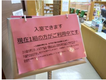
図書館内に1組いる状態